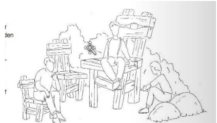
Aufbau von Sitzmöbeln