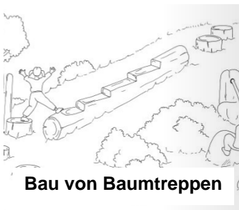
Bau von Baumtreppen