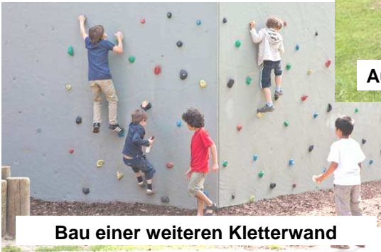
Bau einer weiteren Kletterwand