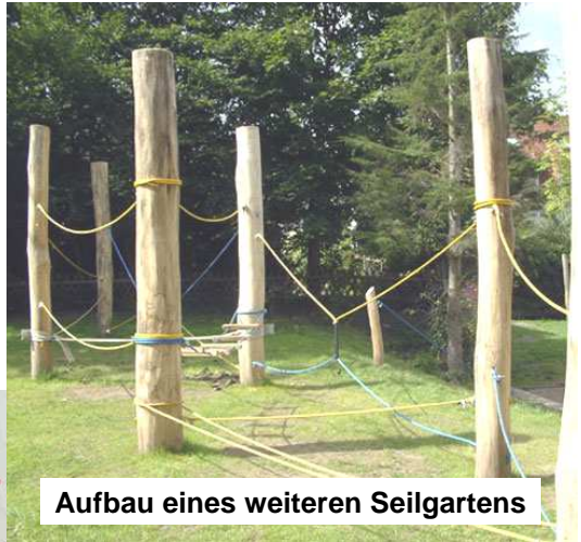
Aufbau eines weiteren Seilgartens